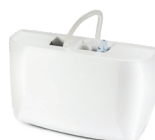
Mini Blanc Deluxe