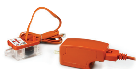
Mini, Maxi & Silent+ Mini Orange